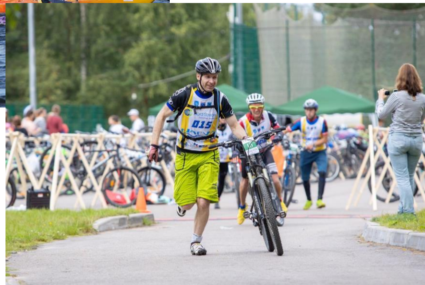
NarvaWatMan ER 25